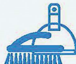
PALA, RASCADOR DE HIELO, CEPILLO DE NIEVE